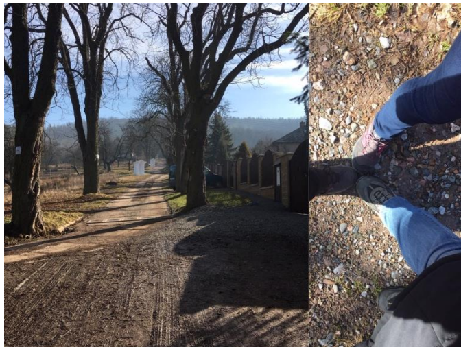
16. 2. - Turistika z Chudčic do Rozdrojovic