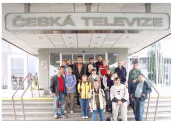
JUN – exkurze v televizi