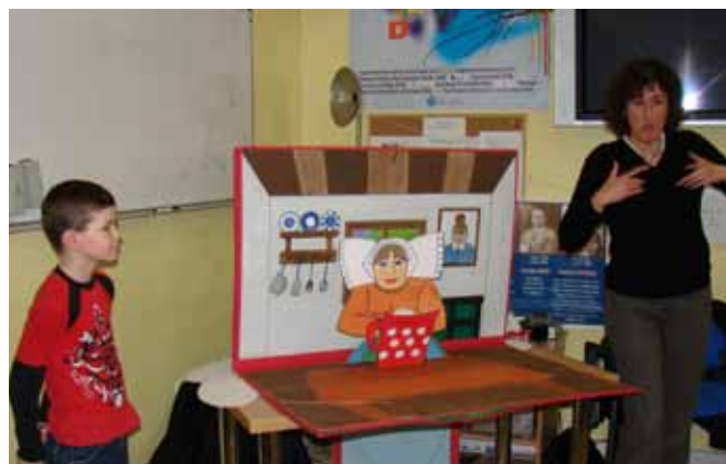
UNB – Pohádka pro děti

Podle zákona č. 108/2006 Sb. o sociálních službách je Unie neslyšících Brno, o.s. zaregistrovaná na služby: tlumočnické služby a odborné sociální poradenství.