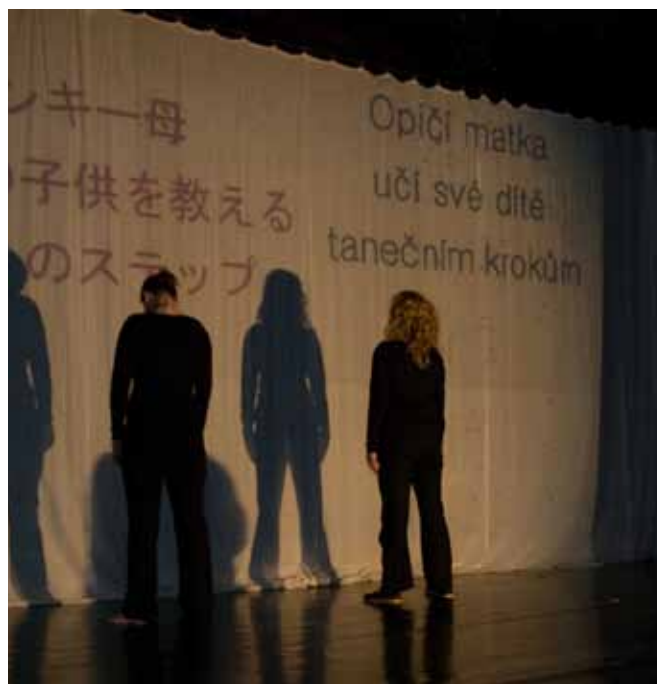
UNB – Divadelní představení Slyšící a neslyšící společně na jevišti