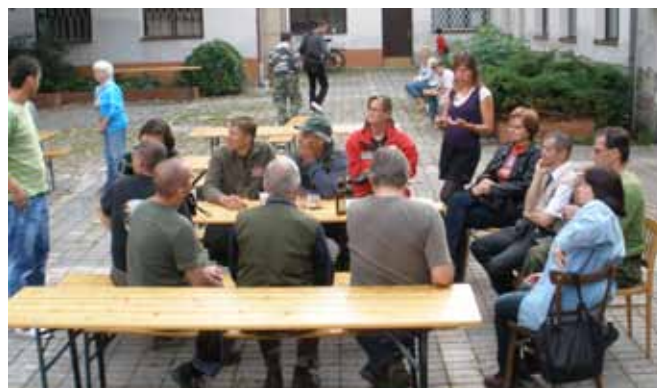
SNB – mezinárodní den neslyšících