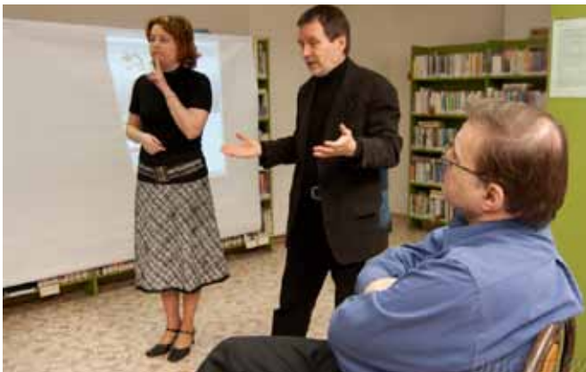
STOP – Slavnostní zahájení provozu TKCN