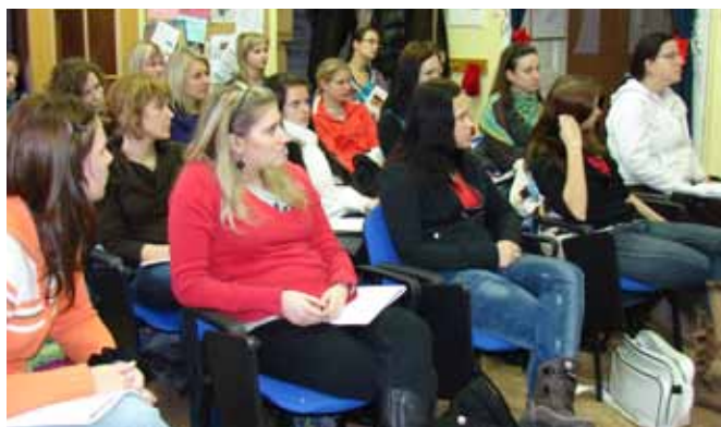
UNB – Vzdělávací kurz pro studenty

– Psychologické poradenství za účasti tlumočnicka znakového jazyka – V psychologickém poradenství zajišťujeme odborné psychologické poradenské služby pro neslyšící v rámci poradny s názvem „Rodinné a individuální poradenství“.