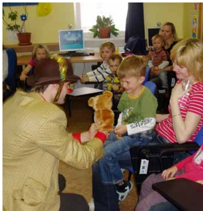
UNB – Den dětí

Ministerstvu práce a sociálních věcí, Ministerstvu zdravotnictví, Ministerstvu kultury, Magistrátu města Brna, Jihomoravskému kraji, Městské části Brno–Královo Pole, Úřadu vlády.