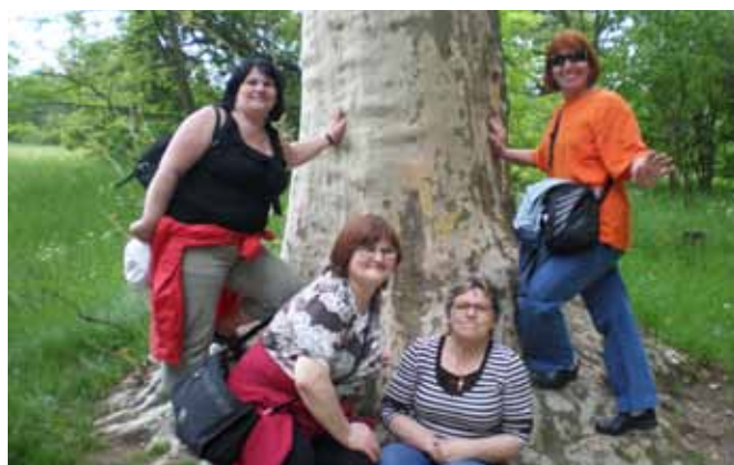
SNB – výlet do Lednice

Forma poskytování sociálních služeb je především ambulantní v Centru sociálních služeb a terénní v případě tlumočení či různých akcí v terénu mimo Centrum sociálních služeb.