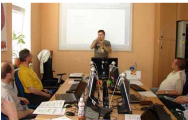
STOP – Kurz ECDL Brno