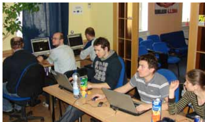
UNB – Počítačový kurz