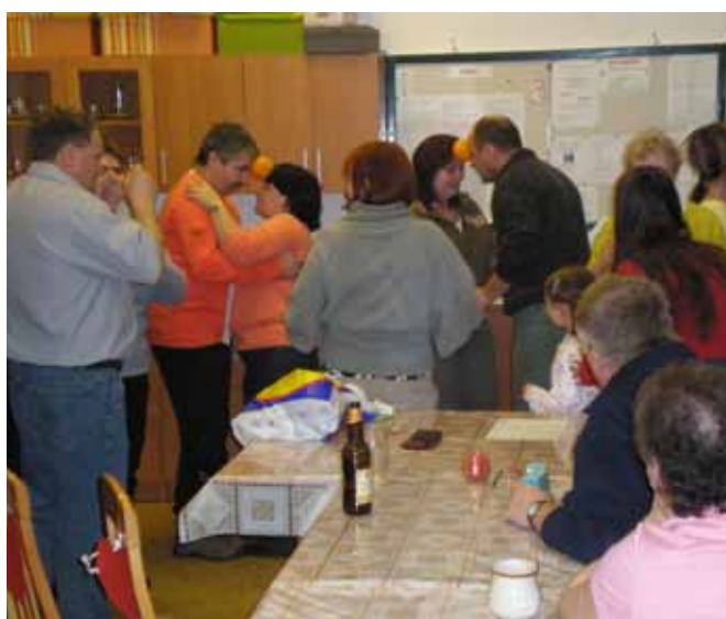
SNB – Valentýnská zábava

Všechny akce – besedy, přednášky, společenské, kulturní a sportovní akce byly vždy předem otištěné v informačním Bulletinu, který členům posíláme každý měsíc poštou domů. Tyto informace jsou i na internetových stránkách naší organizace www.snbreclav.cz .