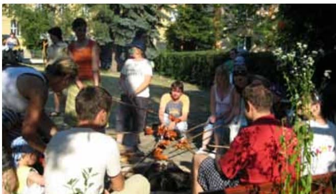
OUN – Zahradní slavnost pro děti

Služba je poskytována z hlediska problematiky sluchového postižení a jeho důsledků.