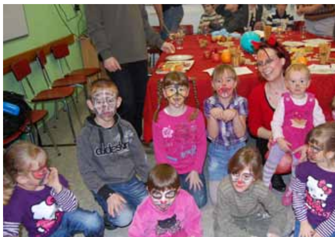
JUN – Mikulášská besídka 2010