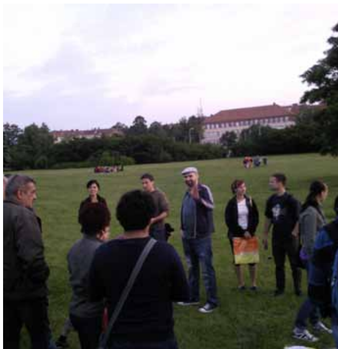
UNB – Vypouštění lampionů štěstí