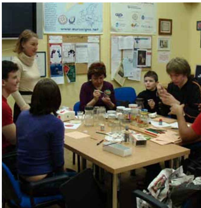
UNB – Tvořivá dílna