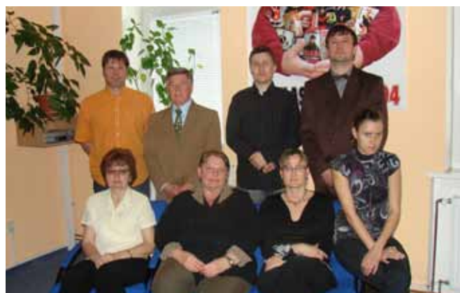
Výbor Unie neslyšících Brno