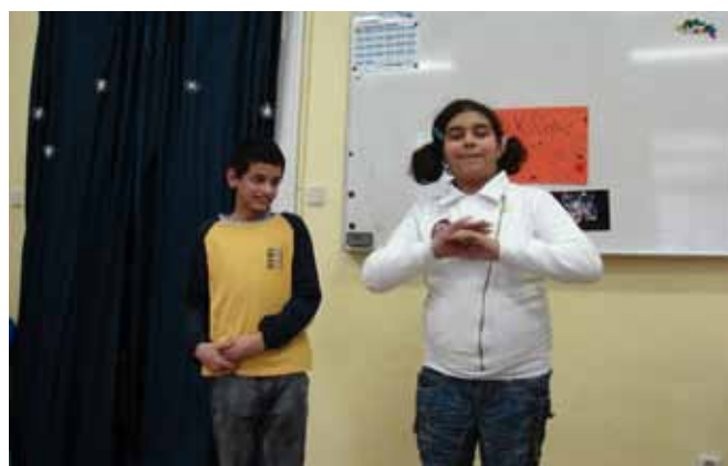
UNB – Soutěže pro děti