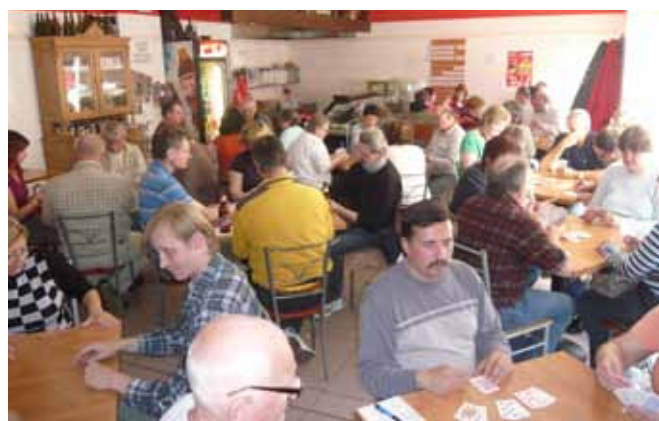
SNB – přátelský turnaj v kartách