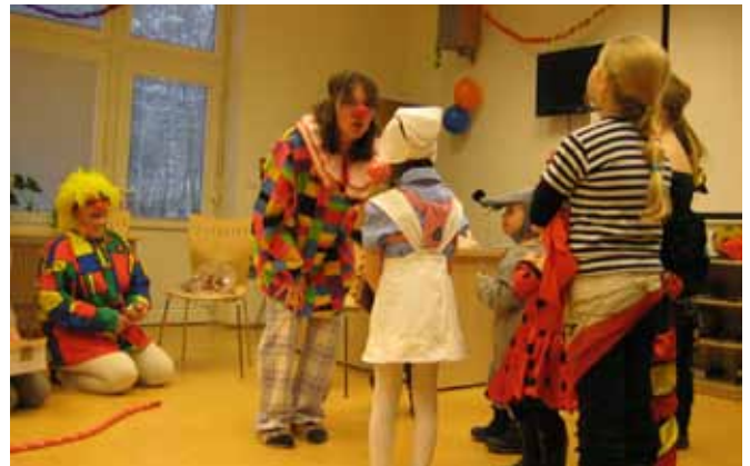
OUN – Karneval