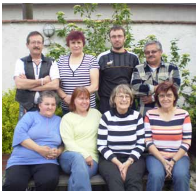
SNB – Výbor