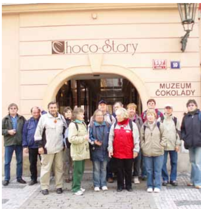
JUN – Muzeum Čokolády Praha