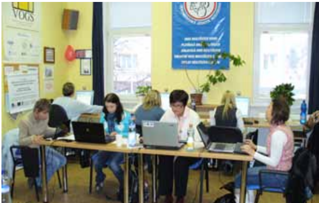
STOP – Kurz budoucích pracovníků TKCN