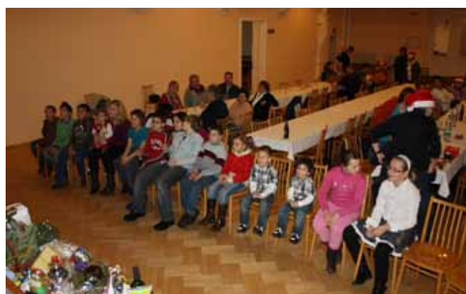
SNB – mikulášská zábava

Dle plánu činností se v roce 2010 uskutečnily tyto akce: