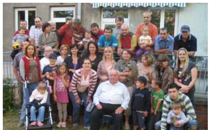
OUN – 60.výročí založení organizace v Olomouci