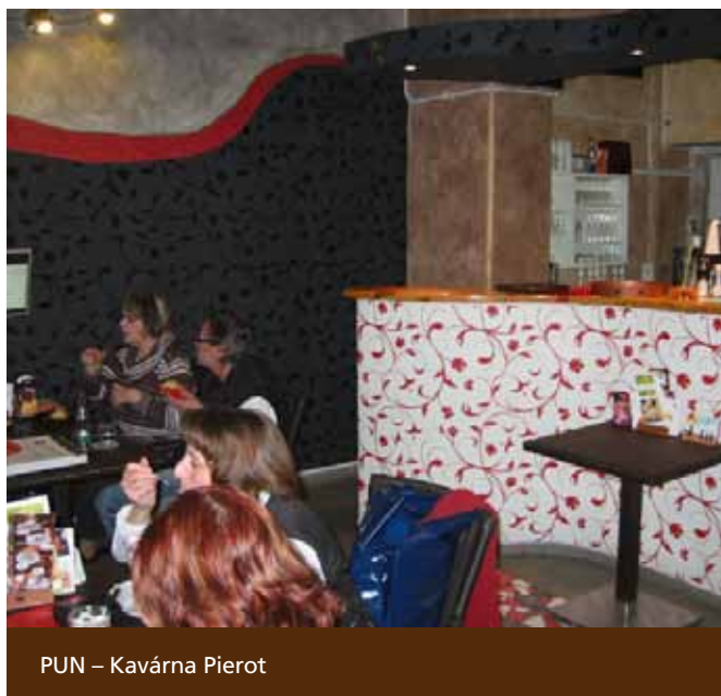
PUN – Kavárna Pierot