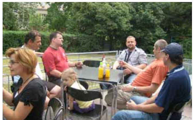
OUN – 60.výročí založení organizace v Olomouci