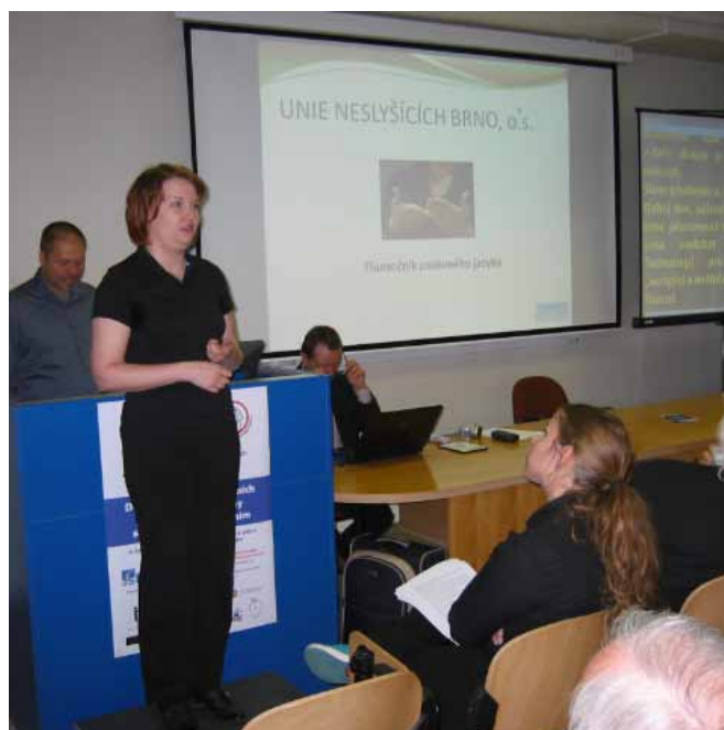
STOP – Odborný seminář v Technickém muzeu

Funkci písemných komunikačních asistentů TKCN vykonávají osoby se zdravotním postižením. Jedná se o slyšící pracovníky s takovým druhem handicapu, který jim nezabraňuje tuto funkci účinně zastávat. Provoz TKCN tak umožnil vytvořit 4 nová pracovní místa pro osoby se zdravotním postižením. Je to praktický příklad uplatnění osob se zdravotním postižením na trhu práce formou služby pro osoby s jiným druhem postižení. V rámci TKCN pracuje také 6 tlumočnicků znakového jazyka, kteří zprostředkovávají on-line tlumočení pro neslyšící přes webkameru.