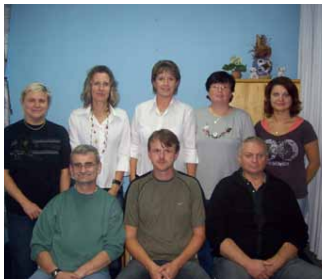
Výbor Plzeňské unie neslyšících

■ Průvodcovské a předčitatelské služby – dle potřeb klienta poskytujeme průvodce (sociální pracovník, tlumočnick do znakové řeči), který zprostředkovává pomoc při vyřizování běžných záležitostí, například na poště, při objednávání se u lékaře apod. dále pak při prohlídce kulturních zařízení a na kulturních akcích pořádaných pro širokou veřejnost. Dle potřeb klienta poskytujeme předčitatelské služby, jako například čtení denního tisku, soukromé korespondence, zpráv od lékaře, soudních obsílek apod.