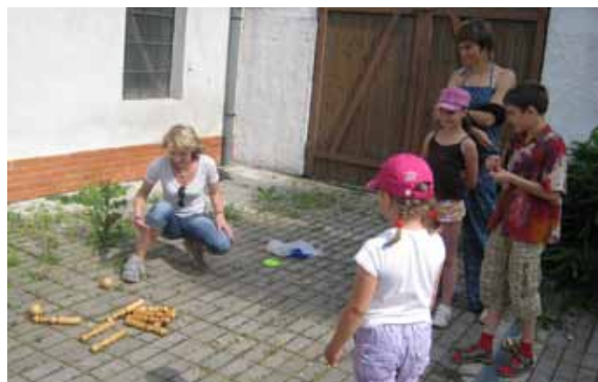
SNB – Mezinárodní den dětí