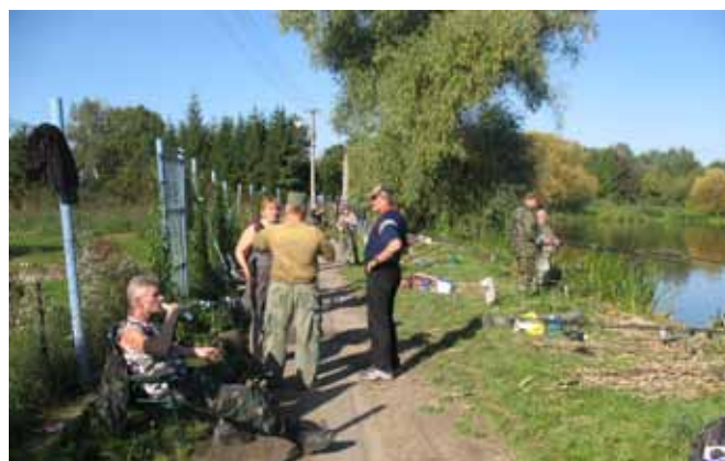
SNB – rybářská soutěž