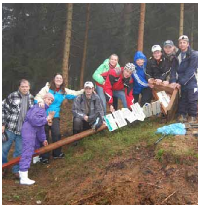
JUN – Rekondiční pobyt Šumava