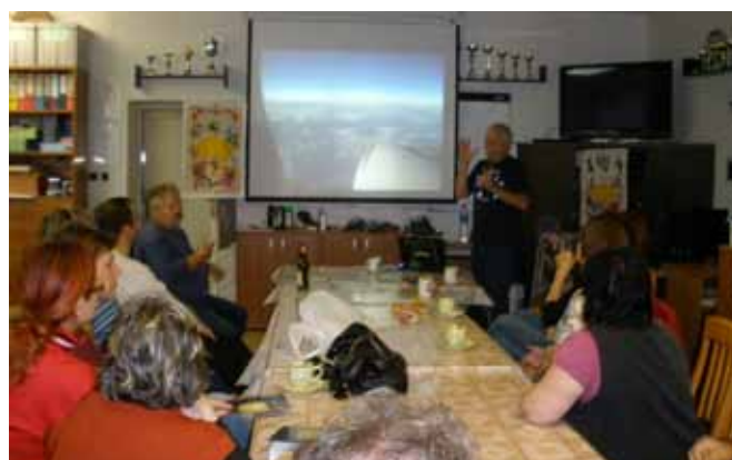
SNB – vzdělávací přednáška